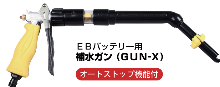
EBバッテリー用 補水ガン (GUN-X)