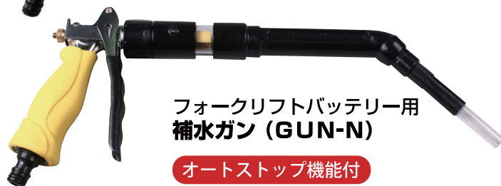
フォークリフトバッテリー用 補水ガン (GUN-N)