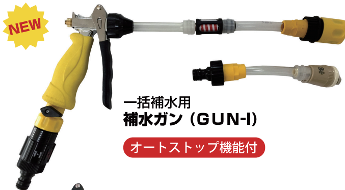
一括補水用 補水ガン (GUN-I)