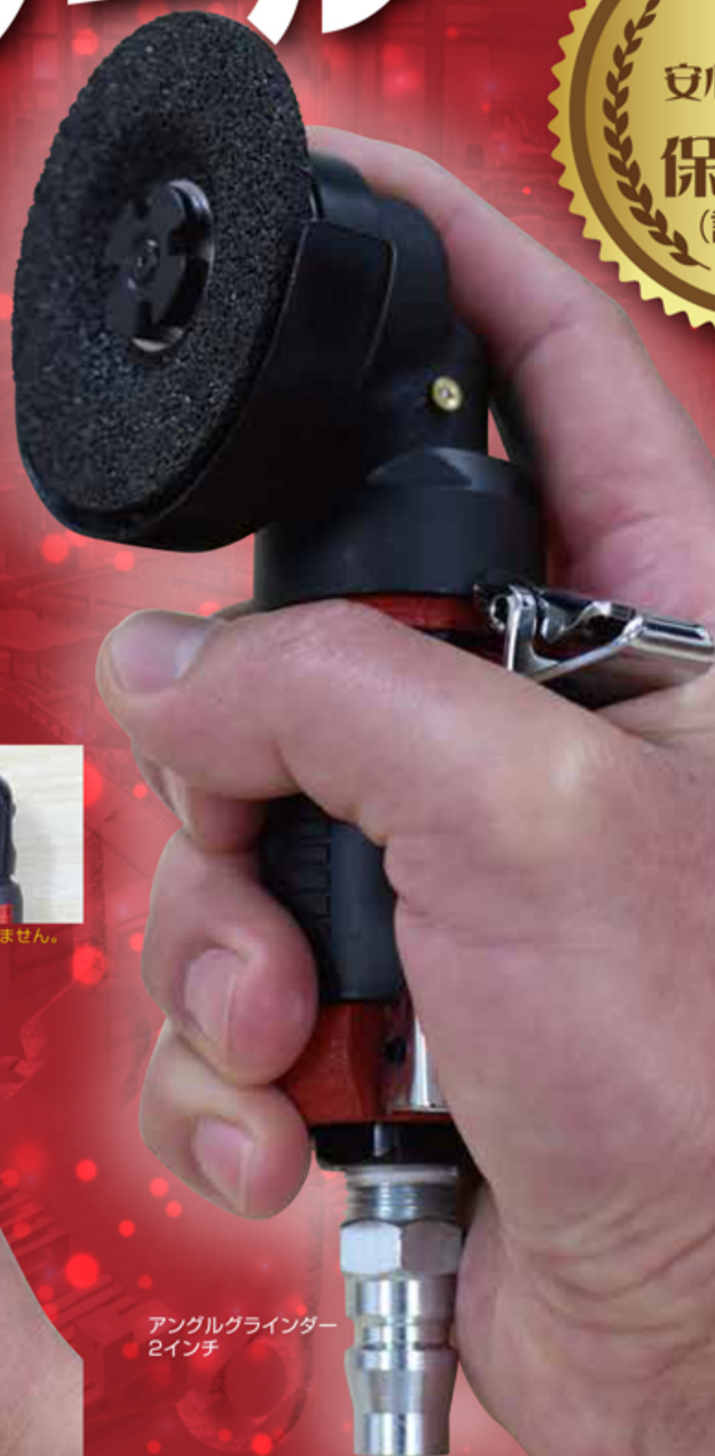
アングルグラインダー 2インチ