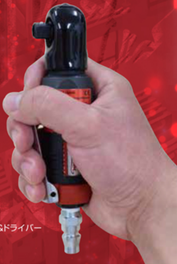
エアージャット&ドライバー